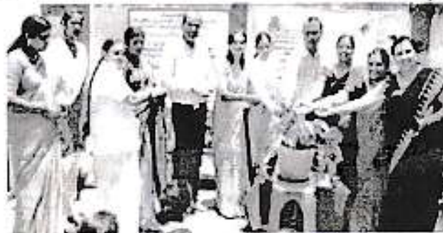
ಪ್ರಾಂಶುಪಾಲಕರು ಮತ್ತು ಇತರ ಅಧಿಕಾರಿಗಳು ಸ್ವಚ್ಛತೆ ಕೊಡುವುದು ಸರ್ಕಾರದ ಕಾರ್ಯವಾಗಿರಬೇಕು.

ಸ್ವಚ್ಛತೆ ಕೊಡುವುದು ಸರ್ಕಾರದ ಕಾರ್ಯವಾಗಿರಬೇಕು. ಆದರೆ ಸ್ವಚ್ಛತೆ ಕೊಡುವುದು ಸರ್ಕಾರದ ಕಾರ್ಯವಾಗಿರಬೇಕು.