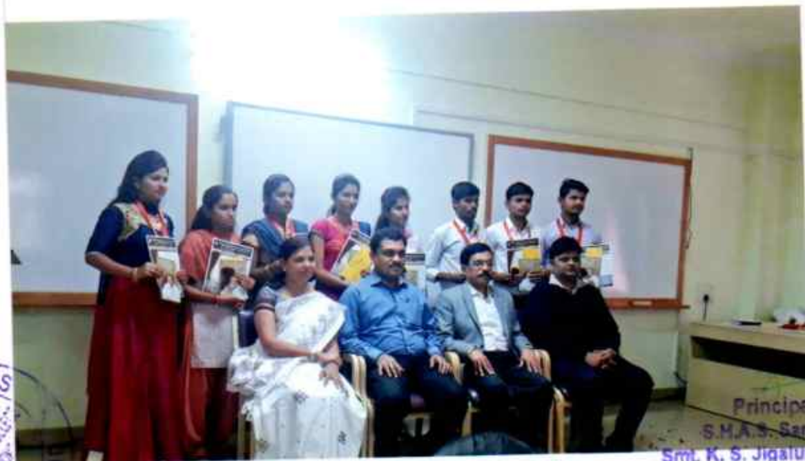
Principal S.M.A.S. Samiti's Smt. K. S. Jigatul Arts and Dr. (Smt) S. M. Sheshgiri Comm College for Women, Dharwad