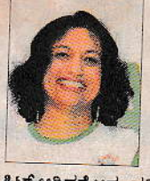
ಫಿಟ್ ಆಗಿದ್ದರ ಆನಂದದಿಂದ

ಒಂದಿಷ್ಟು ಸ್ಪರ್ಧಿಗಳಿಗೆ ಗೆದ್ದೇ ಗೆಲ್ಲುವೆ ಎಂಬ ವಿಶ್ವಾಸ. ಬಹುತೇಕ ಸ್ಪರ್ಧಿಗಳಿಗೆ ತಾನು ಓಡಿದ್ದೇನೆ ಎಂಬ