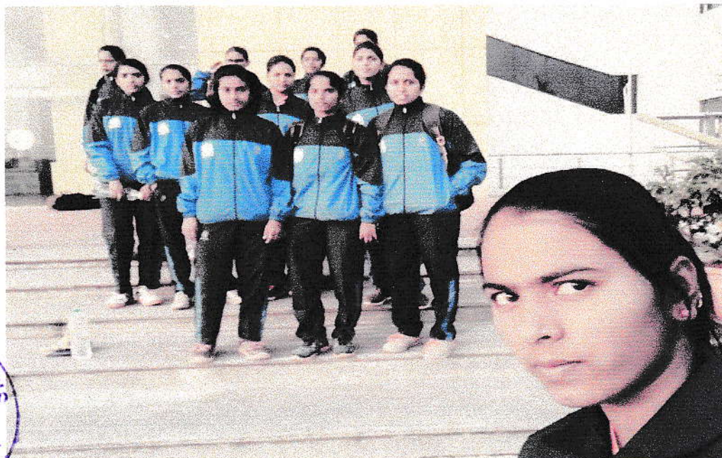
University Volley Ball team at S. R.M.I.S.T Campus, Kattan kulatur, Chennai